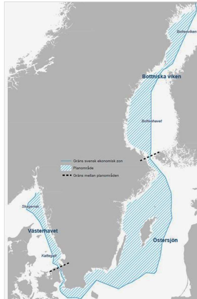
Illustration: Havs- och vattenmyndigheten